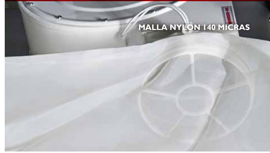
MALLA NYLON 140 MICRAS