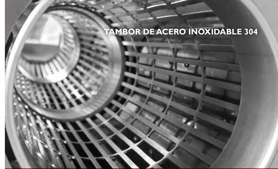
TAMBOR DE ACERO INOXIDABLE 304

https://www.youtube.com/watch?v=KJ7Z86TC-NWE&has_verified=1