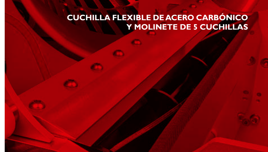
CUCHILLA FLEXIBLE DE ACERO CARBÓNICO Y MOLINETE DE 5 CUCHILLAS