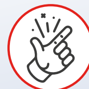
Easy to install Quick to assemble